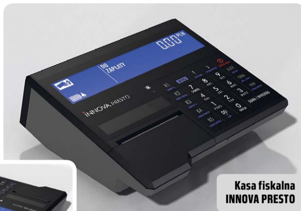
Kasa fiskalna INNOVA PRESTO